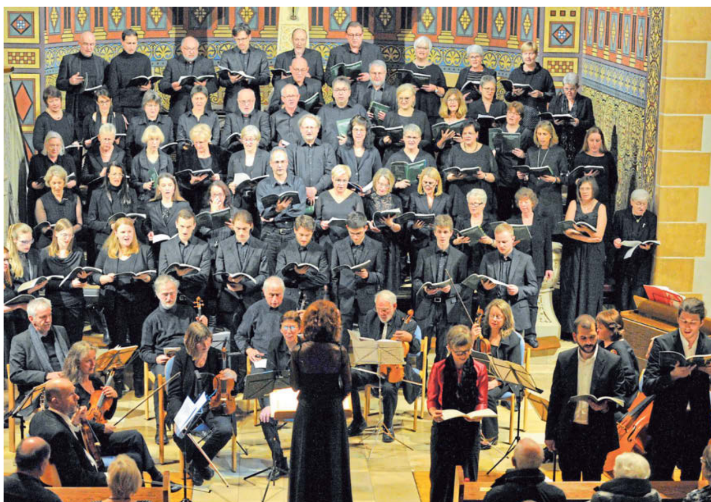
Stimmgewaltig: Die Kantorei und die Jugendkantorei Oberbeck sowie das Orchester Concerto Oberbeck bringen die Sinfonie-Kantate op. 52 von Bartholdy auf die Bühne.